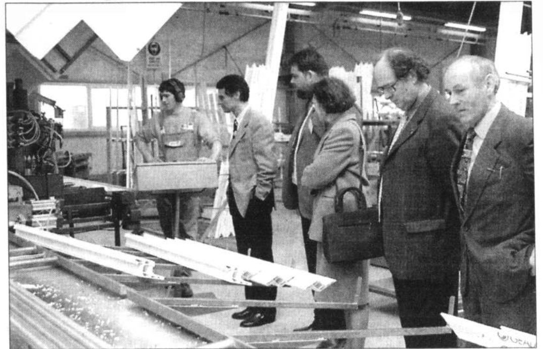
Durant les trois jours de « portes ouvertes » les salariés de B'Plast ont travaillé normalement pour montrer concrètement aux visiteurs leur savoir-faire.

B'Plast a été créée en janvier 1989, à l'initiative de quatre personnes qui se sont associées. Le siège social et la fabrication sont à Vire. Depuis, l'entreprise a ouvert