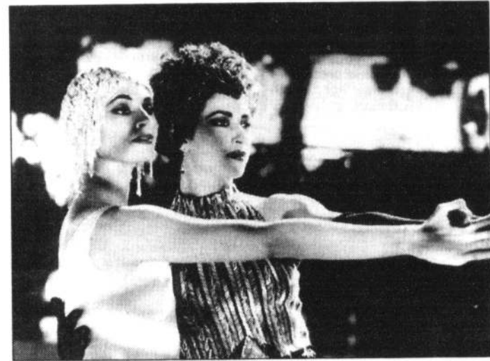
«Tango», comédie dramatique espagnole de Carlos Saura.

Souviens-toi l'été dernier 1. 1997. Durée : 1 h 40. Film d'horreur américain de Jim Gillespie. Avec Jennifer Lowe Hewitt, Sarah Michelle Gellar, Ryan Phillippe, Freddie Prince Jr., Jonny Galecki. Interdit aux moins de 12 ans. La nuit de la fête nationale, quatre jeunes éméchés écrasent un inconnu et, pris de panique, font disparaître le corps au fond de l'eau. Un homicide involontaire dont ils ne sont pas fiers et qu'ils jurent de garder secret. Mais l'été suivant, l'un d'eux reçoit une lettre anonyme.