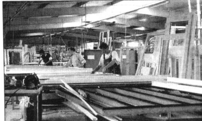
La société B'Plast, spécialisée dans la pose et la fabrication de menuiseries PVC, va fêter dans 15 jours ses dix ans.

L'entreprise B'Plast, spécialisée dans les fenêtres et vérandas, fête cette année ses dix ans d'existence. À cette occasion, la société organise des portes ouvertes. Mais son ouverture étant prévue pour le dimanche 21 mars, il lui fallait l'aval du conseil municipal.